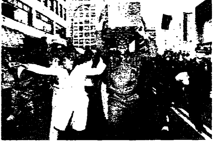
تظاهرة السود في نيويورك بعد تبرئة مونديلو